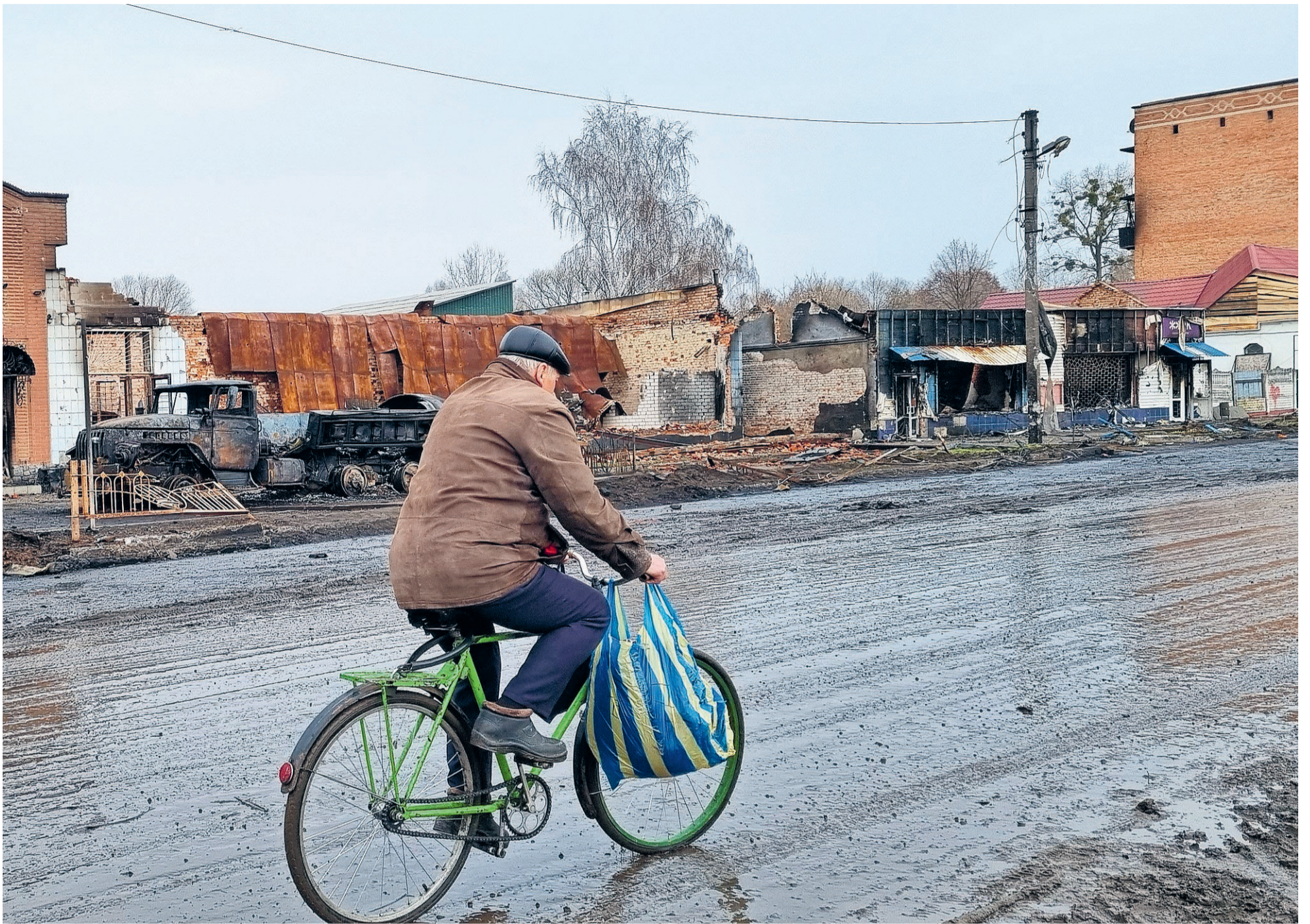
IN MOLDAVIË ZIJN DE LEEFOMSTANDIGHEDEN ERG MOEILIKJ.