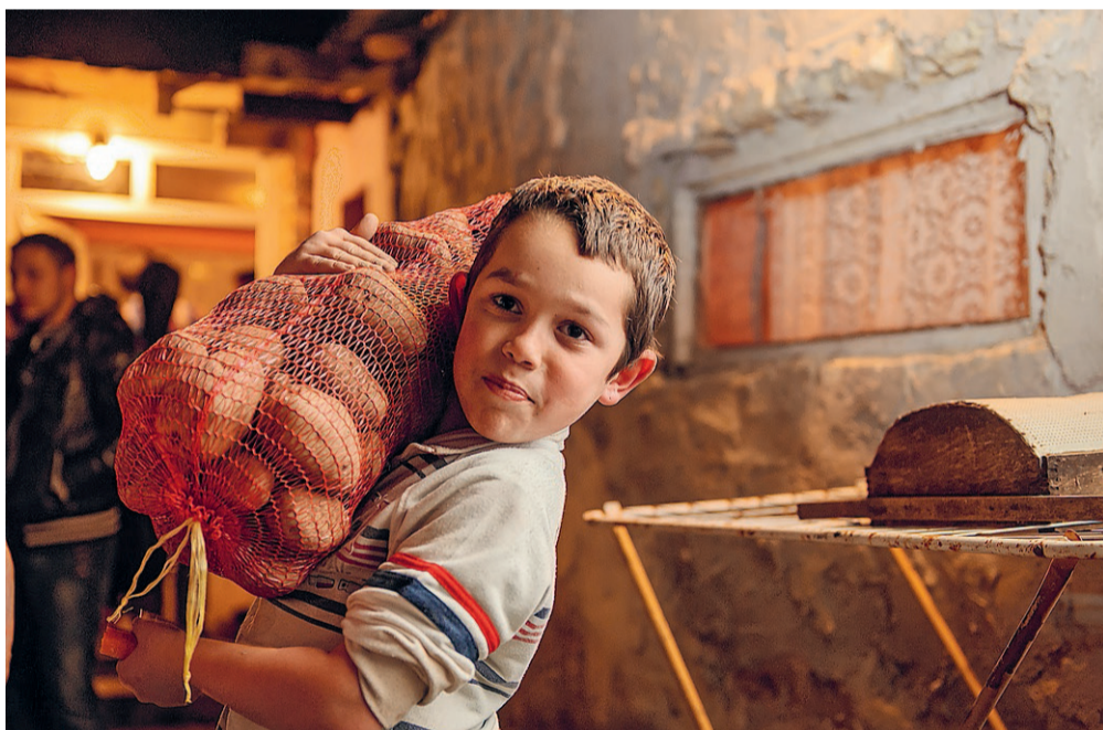
GEBEDSVERHORING: AARDAPPELS VOOR DE ROMA IN SERVIË.

Over een week vieren we Pasen. Jezus is opgestaan. Hij leeft! Die kracht werkt over landsgrenzen, taalbarrières en gevangensmuren heen. Het overwint duisternis, troost mensen, brengt hoop en voorziet – soms heel wonderlijk – in verlatenheid en nood. De kracht van de opstanding in vijf getuigenissen.