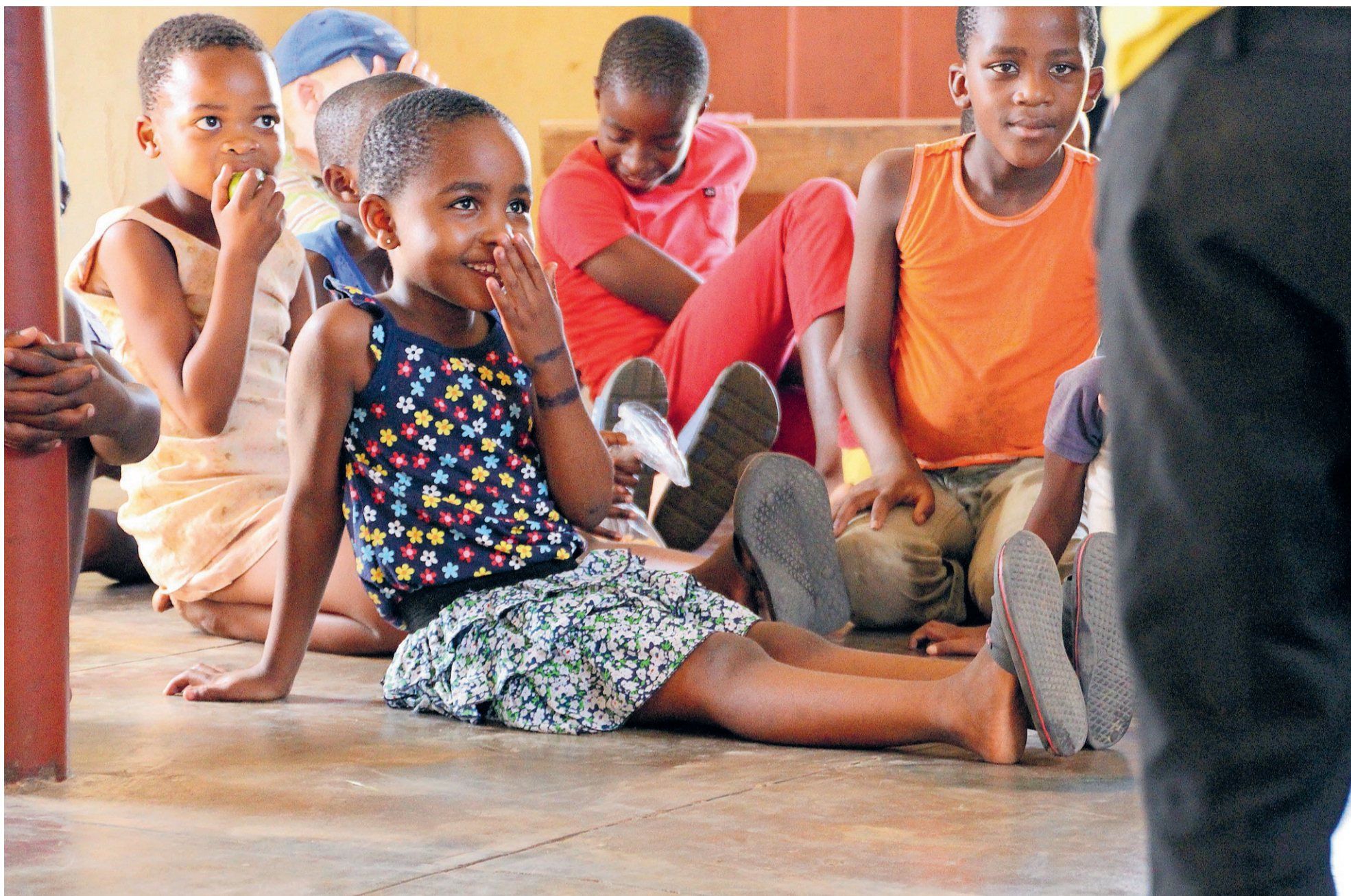
DOOR MIDDEL VAN DRAMA, MUZIEK EN WORKSHOPS WORDEN KINDEREN ONDERWEZEN OVER DE IMPACT VAN HIV/AIDS.