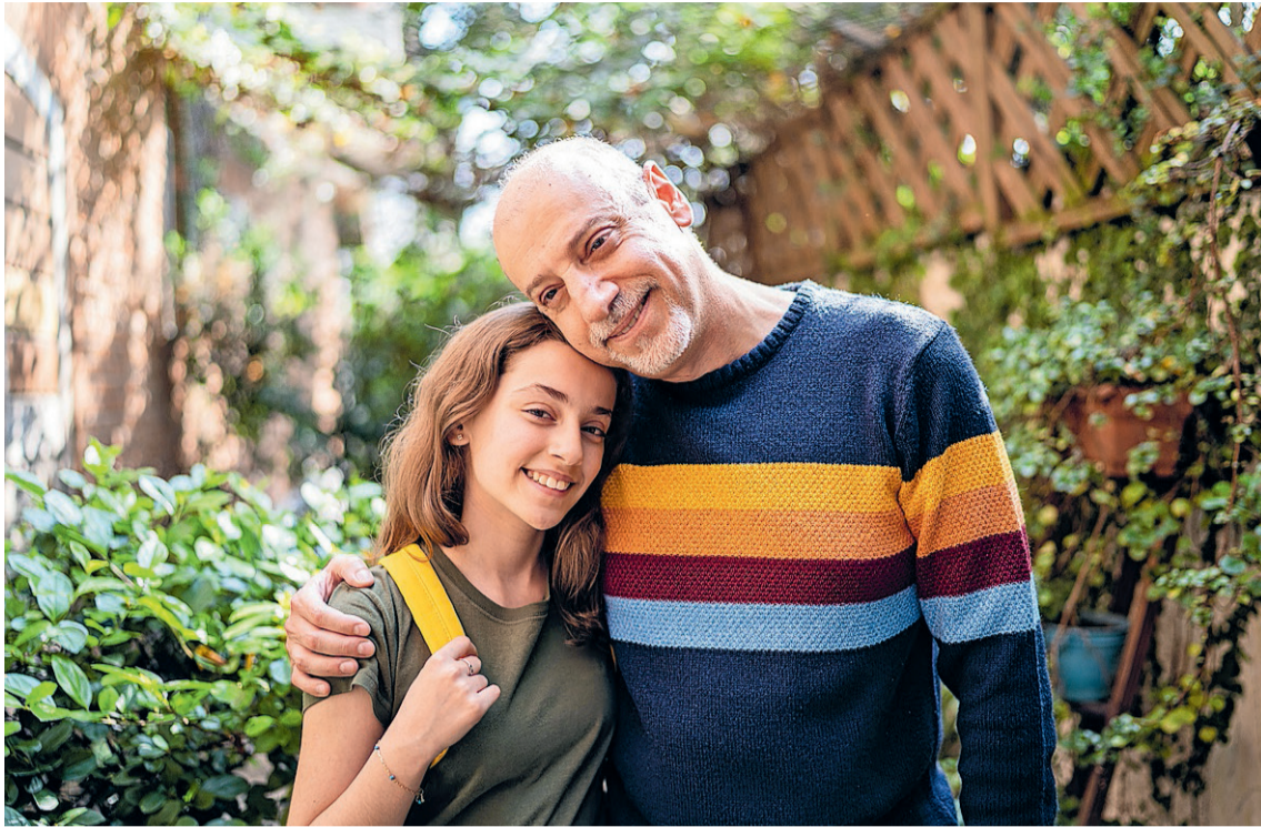
I.V.M. DE VEILIGHEID ZIJN DE PERSONEN OP DE FOTO NIET DIE UIT HET VERHAAL.